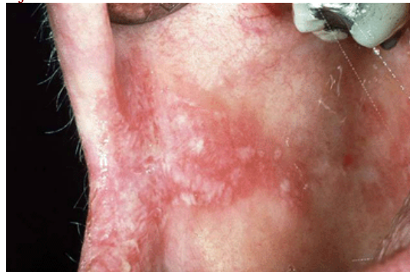
Candida Albican ylikasvua suussa www.whocollab.od.mah.se/expl/oralmuc.html#T

Jokainen koira (kuten ihminenkin) elää todellisuudessa mikro-organismien meressä (bakteerit, virukset, sienet yms.) Näitä mikro-organismeja on nielussa, suussa, nenässä, suolistossa, lähes joka paikassa; ne ovat eläviä osia kehoa. Erilaisia bakteereja on suolistossa satoja, samoin erityyppisiä hiivoja ja muita mikro-organismeja. Yleensä nämä mikro-organismit eivät aiheuta ongelmia, vaan ylläpitävät terveyttä yhteisössä tasapainoisesti keskenään. Ongelmia tulee kun tämä tasapaino järkkyy. Järkyttäjänä voi olla pelkkä stressi, joskin yhä yleisemmin syynä antibioottikuuri ja sen vaikutukset vastustuskykyyn. Vastustuskyvyn soluista yli 70 % sijaitsevat suolistossa !!