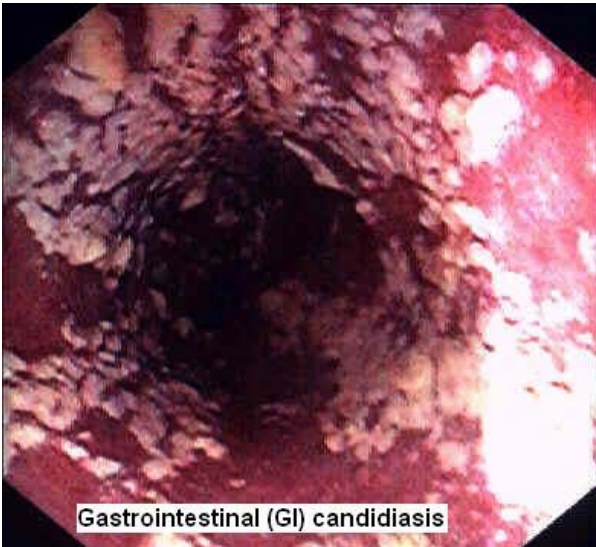
Gastrointestinal (GI) candidiasis

Candida Albicans ylikasvu suolessa http://george-eby-research.com/gif/candida-gut.jpg