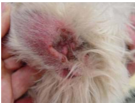
Malassezia pachydermatitis Westien korvassa http://www.whwtc.nl/huidproblemen_bestanden/image008.jpg

Yleisimmin hiivatulehduksen syynä ovat elimistössä yleisesti elävät hiivat. Malassezia pachydermatitis, jota normaalisti löytyy iholla ja korvissa sekä Candida albicans, joka on osa normaalin suoliston mikroflooraa.