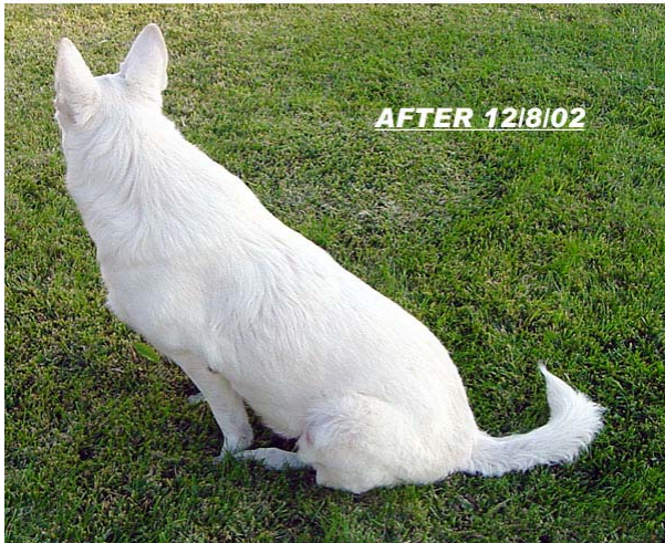
Hiivatulehdus ennen hoitoa ja hoidon jälkeen

http://www.greatdanelady.com/articles/feed_program_for_systemic_yeast_problems.htm